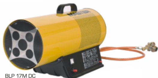
BLP 17M DC

Tato plynová topidla s ručním piezo zapalováním umožňují provoz topidla zcela nezávisle na napájecí elektrické síti po dobu delší než 8 hodin. Lithiovou 3 Ah / 14,4 V baterií lze od topidla snadno odpojit a dobít. Provoz je možný i standardní cestou pomocí elektrického síťového adaptéru. Baterie je kompatibilní s akku BOSCH 14,4V příslušné řady.