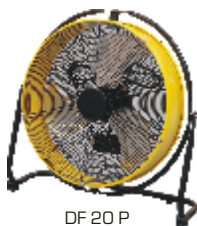
DF 20 P